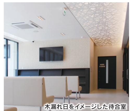
木漏れ日をイメージした待合室

〔そはら内科は、東部小学校の北側にあります。カーナビをご利用の方は「高崎市立東部小学校」を目的地に設定してください。〕